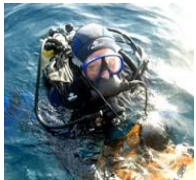
La fouille du site de la Mortella III, les vestiges d'un galion du XVIème siècle en Corse